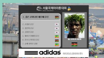
선수 소개/기록 소개